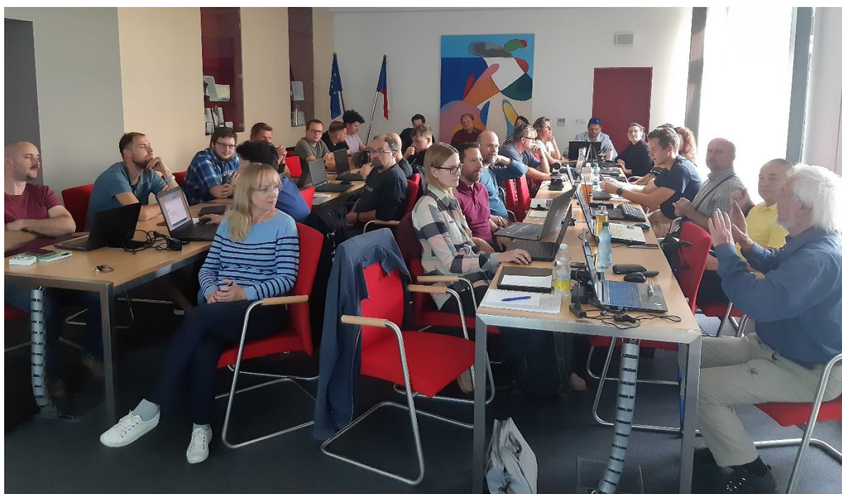
Účastníci semináře v Ostravě 12. 10. 2023